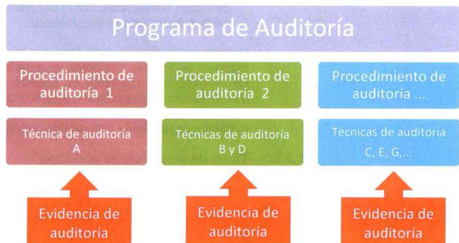
Cuadro n.º 1 Interacción del programa y la evidencia de auditoría

El conjunto de procedimientos sobre aspectos afines permiten su integración en el denominado Programa de Auditoría.